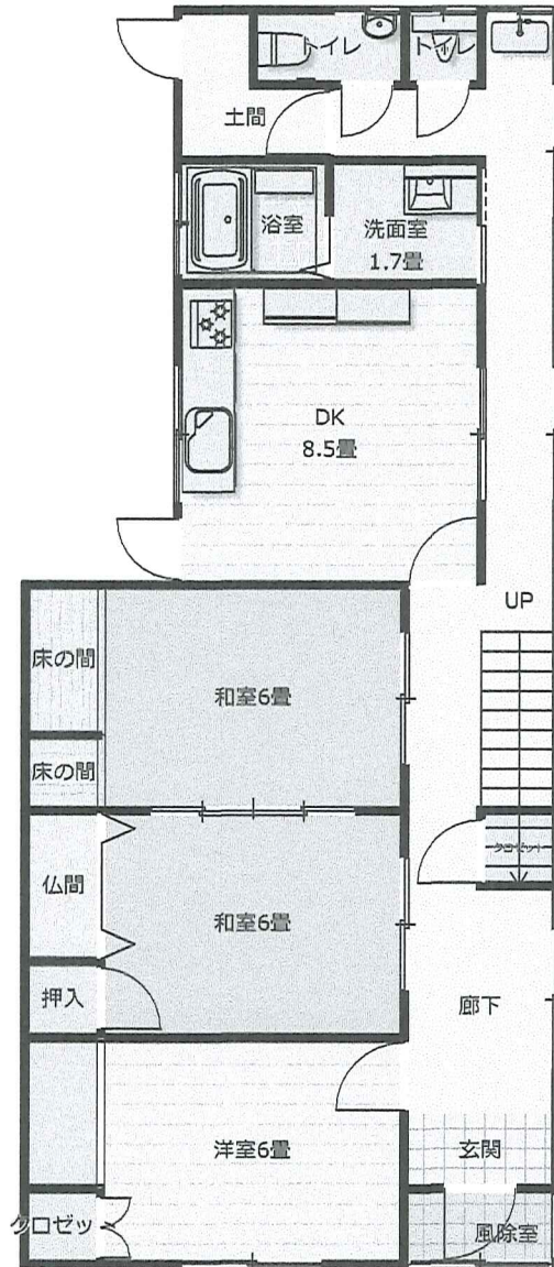
1階 縮尺 1/100