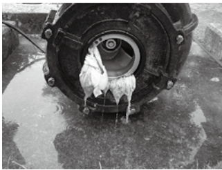
▲中継ポンプにタオルが絡んだ状況

生理用品・ビニール・紙おむつ・異物等、生理用品、ビニール、紙おむつ、ガムなどの異物等は流さないでください。