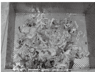
▲水に溶けないもの